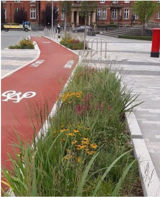
Linnaruumi liigendamine haljastusega, vasemal Manchester, UK 3