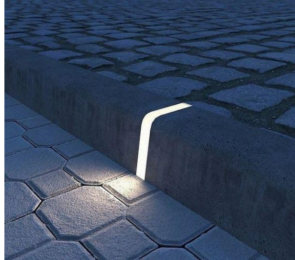
Kõnnitee äärekivisse integreeritud valgustus 17