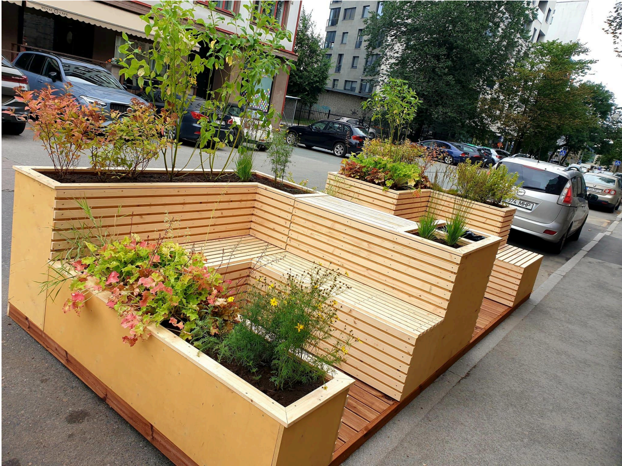
Pink-lillekonteiner - Tallinna Taskupargis 18

Pink ei pea olema vaid pink! Lisaks võib linnamööbel pakkuda kaetud ruumi, varjulisemaid omaetteolemise kohti, seltskondadega ajaveetmise võimalusi, esinemispaiku, liikumisrõõmu ja puhkehetki. Samuti võib kunst olla osa ruumikujundusest - nt skulptuur, mida saab lisaks vaatamisele ka päriselt kasutada.