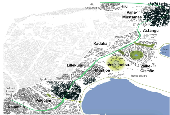
Planeeritud putukaväil Tallinnas 9