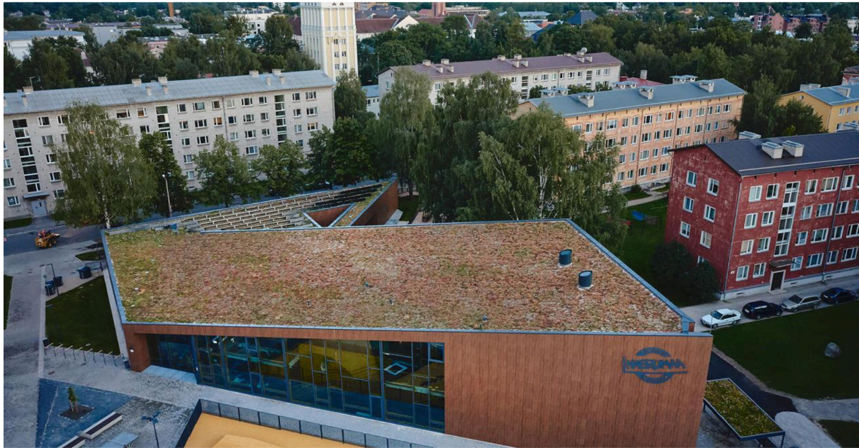
Tartu Naerumaa lasteaia rohekatus (autor Tajuruum) 10

Euroopas koguvad järjest populaarsust murukatused, mis Eestis tänaseks veel väga kõvasti kanda kinnitanud ei ole. Murukatusel on esteetiline, ökoloogiline ja praktiline väärtus, mis sobitub suurepäraselt erinevatesse keskkondadesse. Nad toovad leevendust linna vihmaveesüsteemile, seovad õhus lenduvat tolmu ja summutavad müra. Ja mis kõige olulisem - murukatus on silmale ilus ja roheline vaadata! Murukatuse võib ehitada nii klassikalise hooldusvaba roheline katusena kui ka õitsva ja hoolitsetud katusaiana.