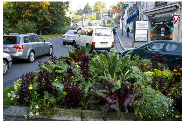
Efektse välimusega toidutaimed linnaruumis 2