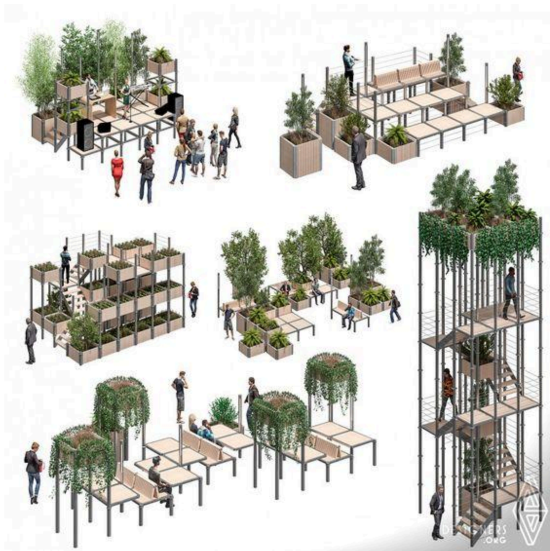
Modulaarne linnamööbel 19