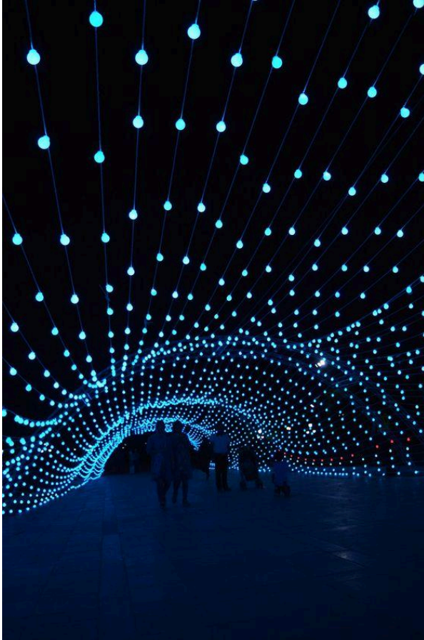
Valgusinstallatsioon Teheranis 16

Väliruum peab olema vajalikul määral nähtav ja turvaline läbida-kasutada, samal ajal saab valgustus välja tuua võluvaid objekte või luua meeleolusid, mis päeval tunduvad nii tavalised või ilmselged (nt puud, müüriorvad, jalakäigutunnelid jne). Valgust saab lisada erinevate valgustitega - mastvalgustid, pollarid, prožektorid. Kuid samuti on võimalik integreerida valgus kujunduselementide sisse ning moodustada põnevaid lahendusi. Kaasaegsemad viisid hõlmavad ka nn tarku kõnniteid, mis salvestavad päeval päikesevalgust ja öösel helendavad. Kuidas saaksid valgusega tekitada meeldiva ja kutsuva ala?