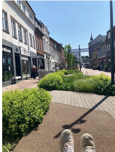
Kolding, Taani. Erakogu