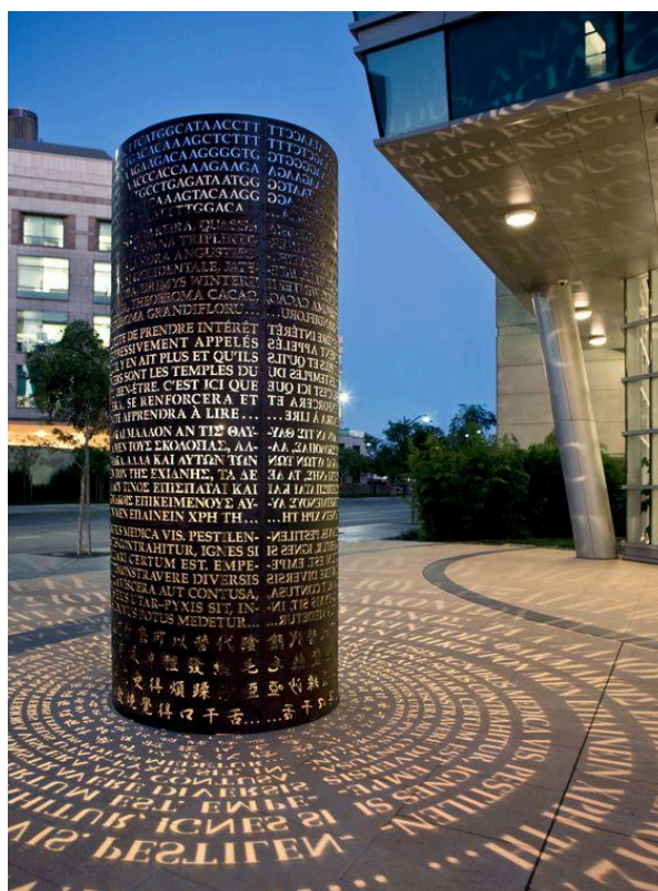
Valgustielement Helsingis 15