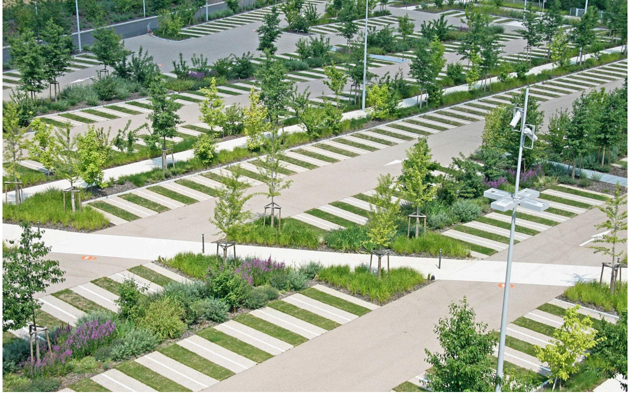
Zenith de Strasbourg kontserthalli parkla Prantsusmaal.