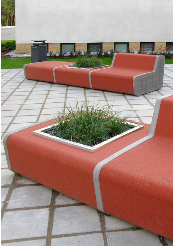
TTÜ hoovilahendus (autor Kivisilla aia- ja maastikukujundus) 4