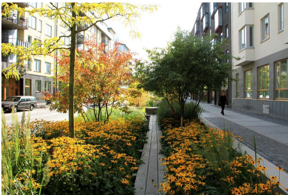
Mitmekülgne ja -rindeline tänavahaljastus Rootsis 1

Haljastus, sh lilled, puud, vertikaalhaljastus, murukatused, linnaaiad, on oluline mitmest seisukohast. See pakub esteetilist naudingut, aitab vähendada heitgaasidest tekkivat õhusaastet ja on ühtlasi mürabarjääriks. Samuti toimib haljastus linnakeskkonnas rohekoridorina erinevatele linnu- ja loomaliikidele ning putukatele. Linnalooduse ja -haljastuse teemat võib konkursitöö valmistamisega paralleelselt käsitleda ka loodusõpetuse tunnis. Pelgalt muruplatsidest linnaruumis ei piisa, vaid oluline on ka liigiline mitmekesisus, samuti haljastusest saadav esteetiline kogemus.