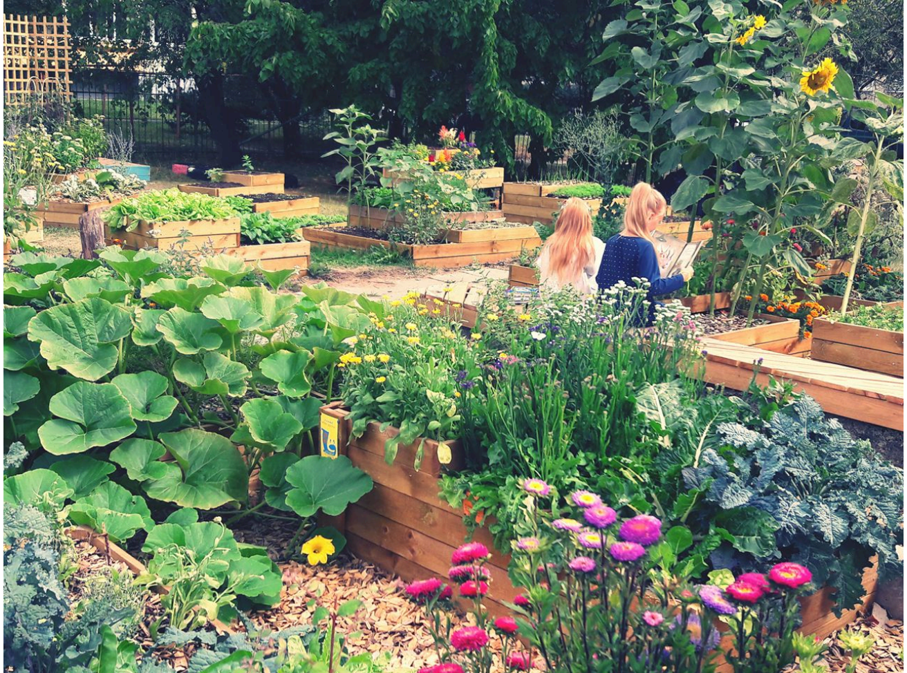
Laagna aed Lasnamäel 6