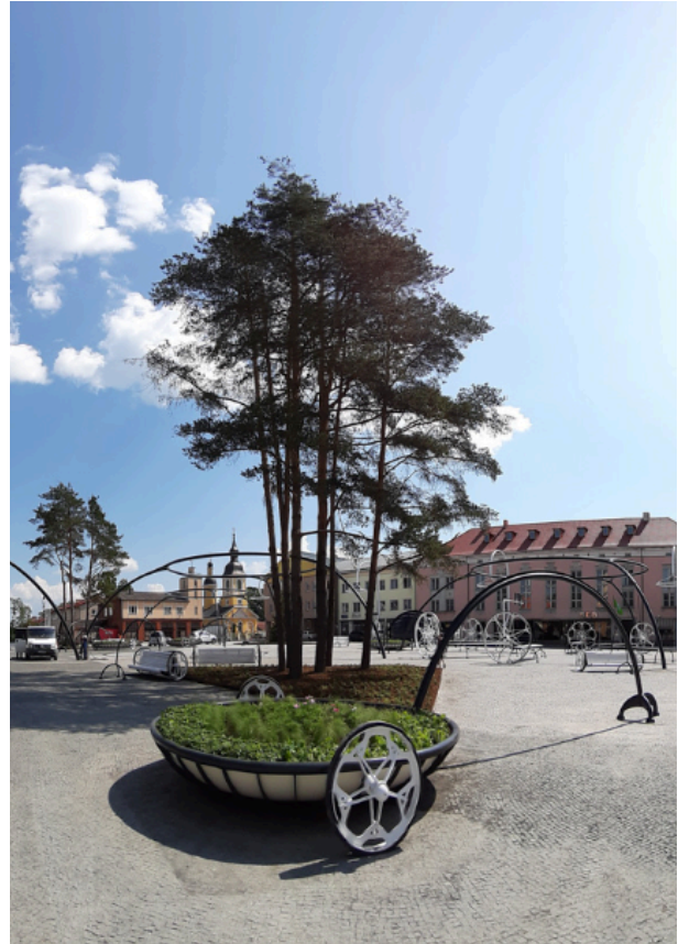
Võru uus keskväljak (autor Stuudio Tallinn).