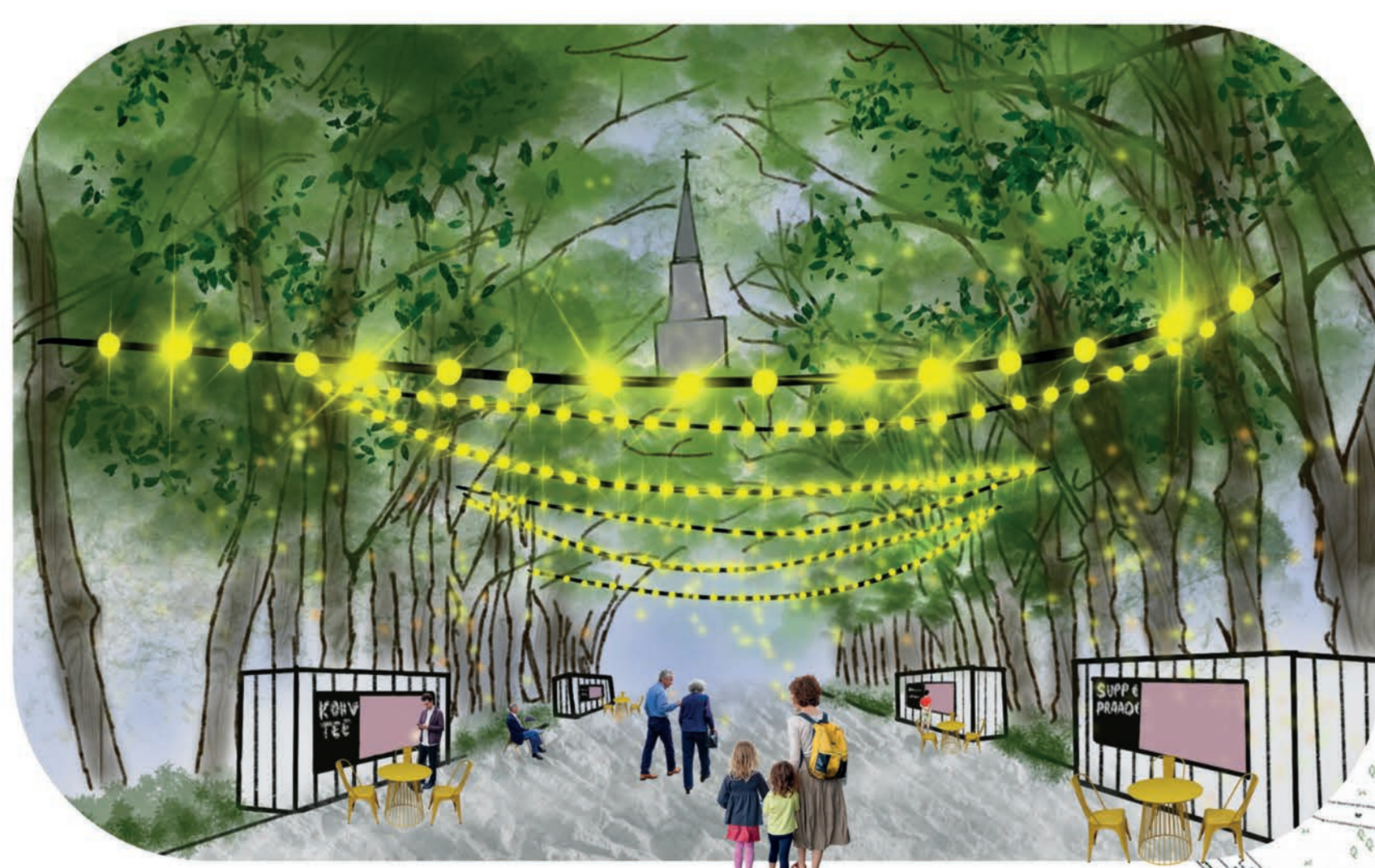
Vaade tuleviku toidutänavale