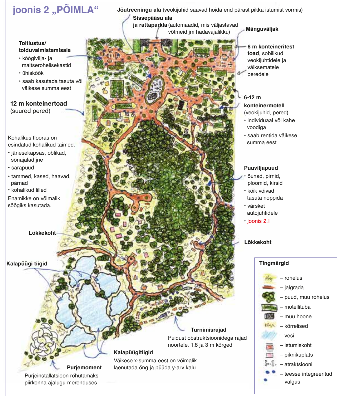
joonis 2 „PÕIMLA“

Ka tegevusi leidub palju. Inimestel on võimalik püüda kala, läbida ronimisrada, külastada monumente, näitusi, mõnda poekes või toitlustuskohta, korjata metsaande ja palju muud. Tähelepanuta pole jäänud ka kultuur. Piirkonda on planeeritud mitu rahvuskultuurile või ajaloole pühendatud monumenti. Friikate ja viinerite asemel pakutakse mulgiputru, musta leiba ja kamavahtu. Hoonete puhul on esile tõstetud rahvustundeid. Enamik hooned on projekteeritud mõne Eestile iseloomuliku rahvusliku segmendi järgi.