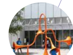
Heliinstallatsioon (vt. joonis 1)

HOSTEL asub peamaja vastas metsa ääres, kus külalised saavad viibida rahu ja vaikuses. Hosteliil on roheline fassaad, kus kasvavad ronitaimed. Hoone on üsna väike ja minimalistlik, põhirõhk on puhtal ja kaasaegsel öömajal.