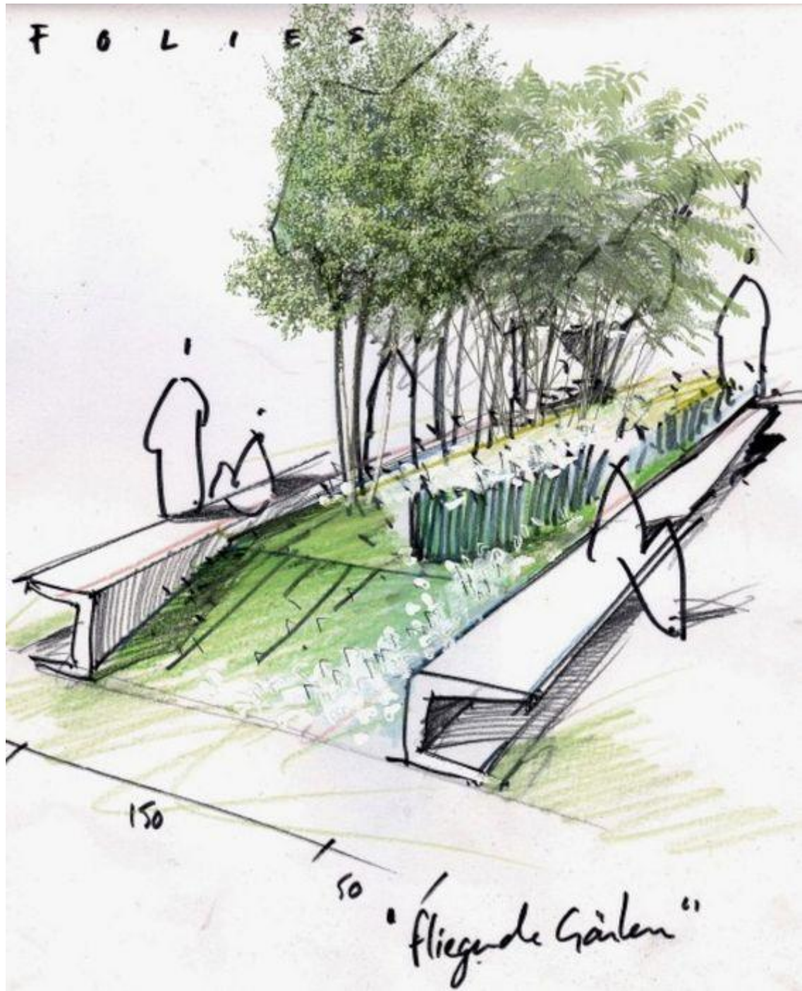
Näide detaili vaatest

https://sawhd.com/top-15-gorgeous-landscape-plan-drawing-section-images/the-best-landscape-plan-drawing-section-no-150/