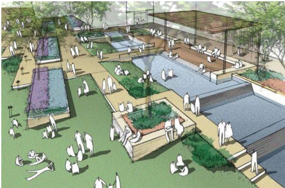
Näide ühest ruumilisest vaatest alale

https://landskapsarkitekt.tumblr.com/post/134467260558