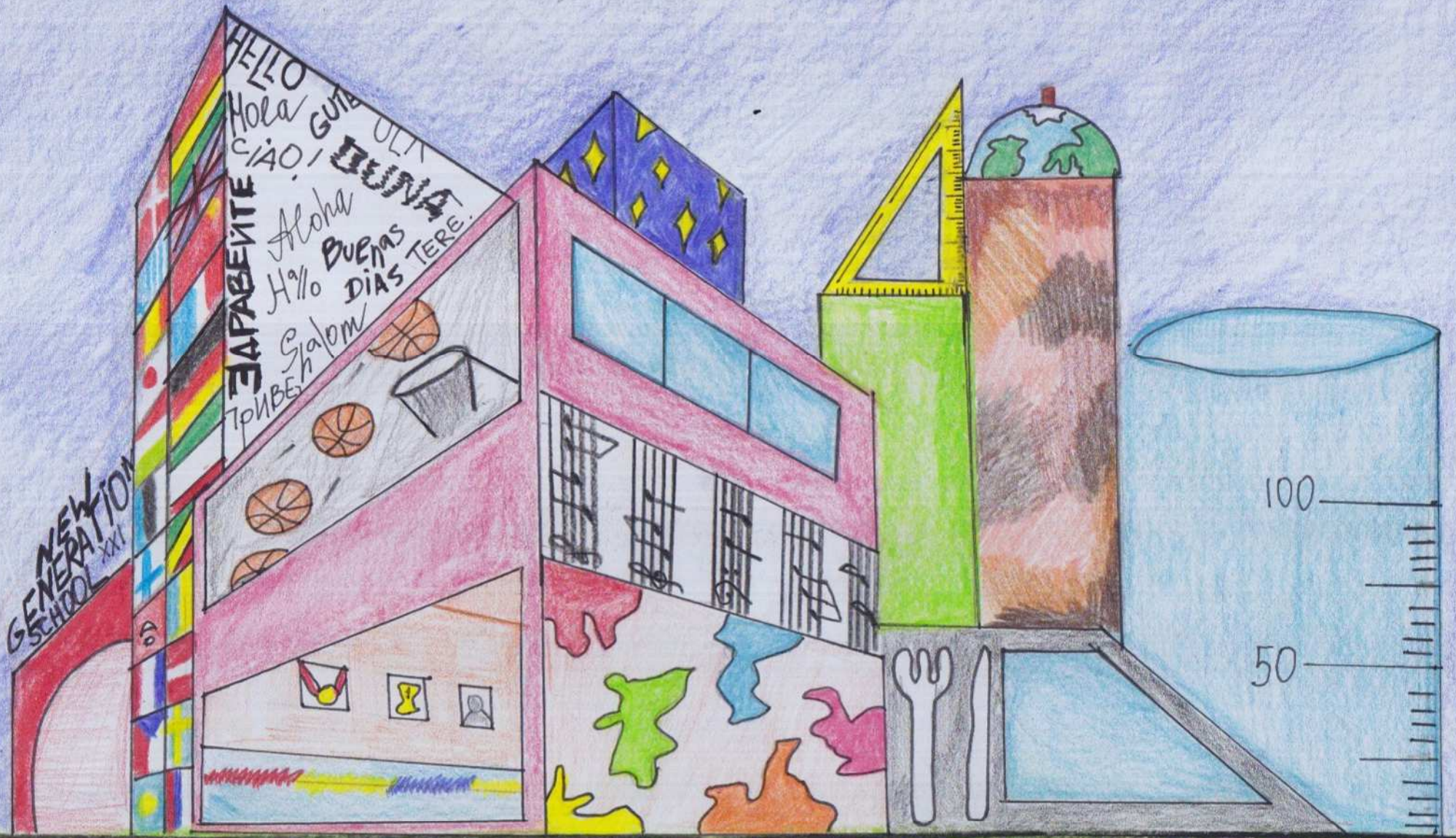
Märrausöna: New Generation School XXI