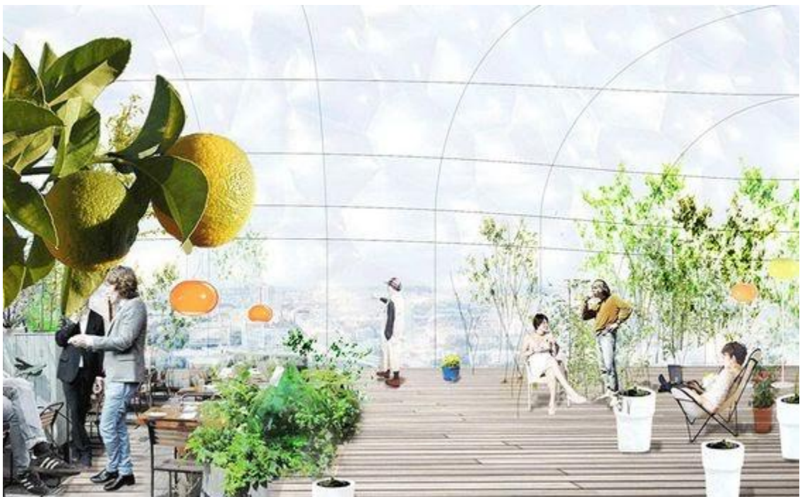
Näide segatehnikas vaatest https://www.designboom.com/architecture/selgascano-drivhus-greenhouse-stockholm-city-plan