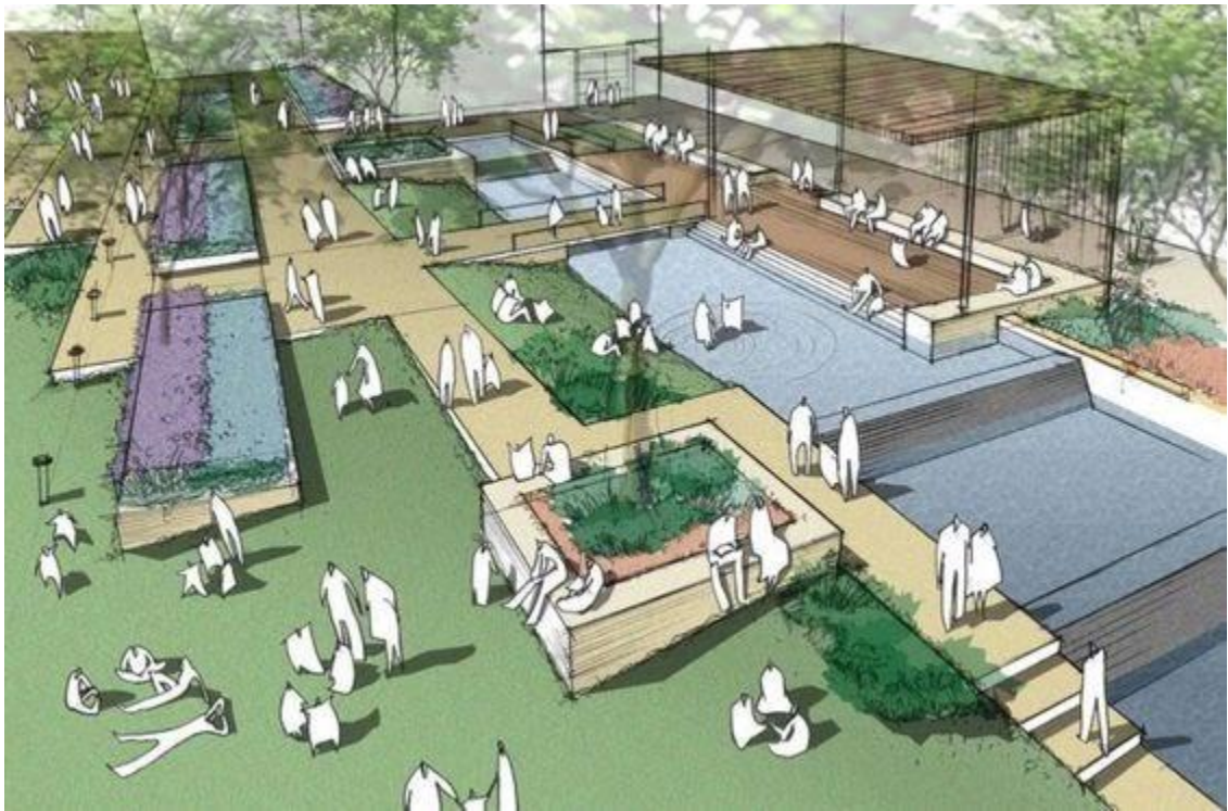
Näide ühest ruumilisest vaatest alale https://landskapsarkitekt.tumblr.com/post/134467260558